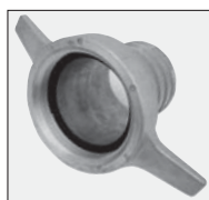
nasady 2 szt.